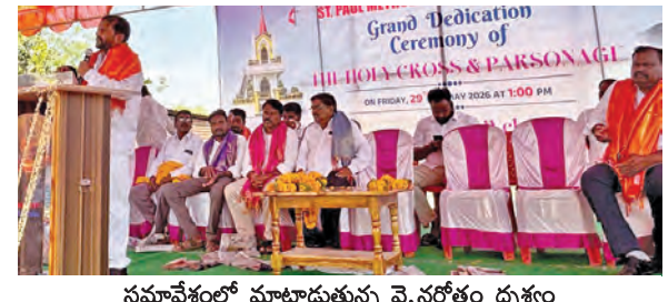
సమావేశంలో మాట్లాడుతున్న వై.నోత్రం ధ్యేయం