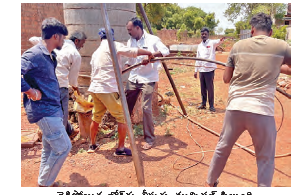
చెడిపోయిన బోరు తీస్తున్న మున్సిపల్ సిబ్బంది