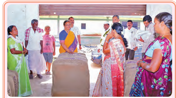
గోదావరి పరిశీలిస్తున్న జిల్లా కలెక్టర్ ప్రామాణి