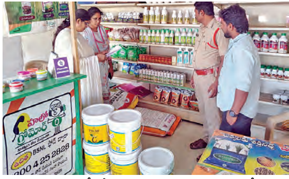
పాపను తనిఖీ చేస్తున్న మండల ట్యాంక్ ఫోర్స్ కమిటీ