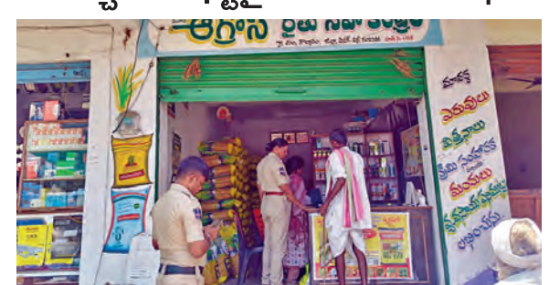
తనిఖీలు నిర్వహిస్తున్న అధికారులు