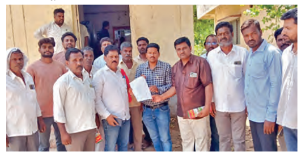
తహసీల్దార్ కార్యాలయం ఎదుట రైతుసంఘం ధర్నా